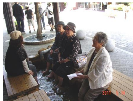
金の湯の足湯でほっこりと